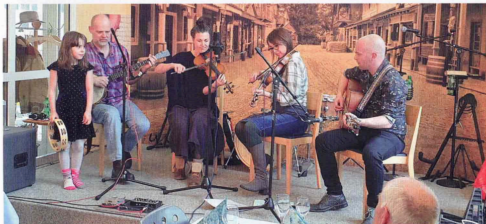
The Roustabouts and Friends