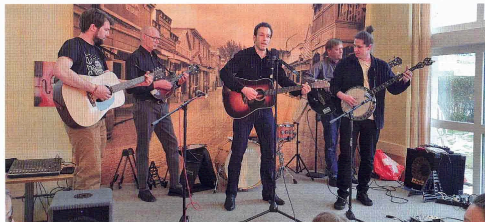
Small Windows Marmelade